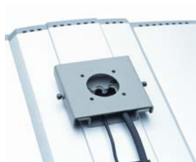
MultiQ Wall Bracket for POS Part no ACC100551