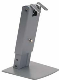
MultiQ POS Stand Part no ACC100548

Technical specifications are subject to change without prior notice. PURETECH® is a registered trademark of MultiQ